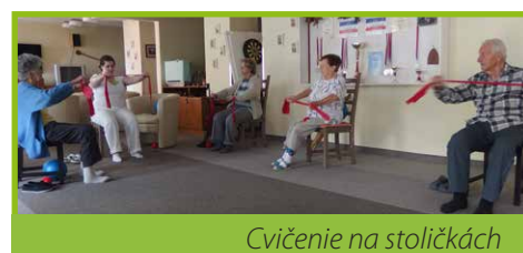
Cvičenie na stoličkách

Súčasťou zdravotného úseku Domu tretieho veku je aj fyzioterapeutický - rehabilitačný úsek. V nej sa sústreďujeme na pohyb, ktorý je dôležitý v každom veku. Každému vyhovuje iný druh pohybu, preto na výber ponúkame rôzne druhy cvičenia. Ráno začíname hýbaním sa v telocvični, kde sa pravidelne cvičí pod dozorom fyzioterapeuta v skupinke 4 až 6 klientov. Každý si vyberá prístroj podľa svalových partií, na ktoré sa chce zamerať. Pri pravidelnom cvičení sa zlepšuje kondícia. Popoludní prebieha