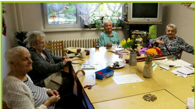
Klienti Domu tretieho veku v tvorivej dielničke

sebavyjadrenie, sebareflexiu, vizuálne a verbálne usporiadanie zážitkov a uvoľnenie. Klientky zo samostatných bytových jednotiek sa stretávajú v rámci krúžku „Šikovné ruky“. Hlavným cieľom je udržať záujem o ručné práce a tvorivosť. Obsah tvorí práca s rôznymi technikami, rozvoj zručnosti, tvorivosti, fantázie a trpezlivosti. Výroba rôznych ozdobných predmetov a darčiekov je využívaná na reprezentáciu Domu tretieho veku pri rôznych spoločenských podujatiach.