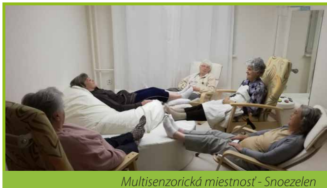
Multisenzorická miestnosť - Snoezelen

Multisenzorická miestnosť – Snoezelen je jedným zo špecifik zariadenia kde prebiehajú relaxačné cvičenia. Nejde však o cvičenie ako také. Relaxácia je technika, ktorá vedie k nácviu určitých fyziologických stavov, spojených s hlbokým uvoľnením – psychickým aj fyzickým. Tak ako pocity ovplyvňujú každého z nás, tak zmena telesných stavov dokáže spätne ovplyvniť pocitové prežívanie človeka. Ak uvoľníme telo, uvoľníme aj myseľ. Takáto stimulácia napomáha pri problémoch so spánkom, pri regulácii úzkosti a napätia, pri rôznych somatických chorobách. Po samotnej relaxácii sa spoločne rozprávame o prežitom. Často sú to spomienky na detstvo: lány, polné cesty, žblnkotajúce potôčky... Vôňa kvetov a spev vtákov veľmi živo dotvárajú tento neobvyklý príjemný zážitok.