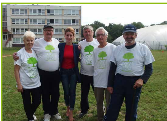
Klienti s pani riaditeľkou na športových hrách