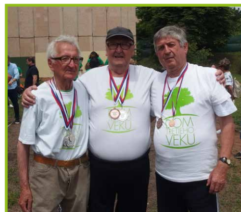
Ocenení športovci Domu tretieho veku 2018