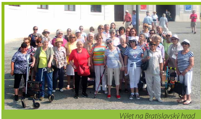
Výlet na Bratislavský hrad