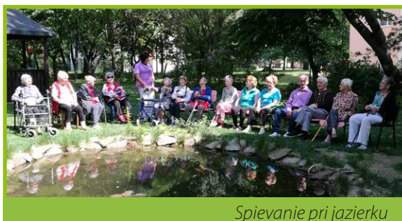
Spevanie pri jazierku

Kolektív sociálnych pracovníkov Domu tretieho veku