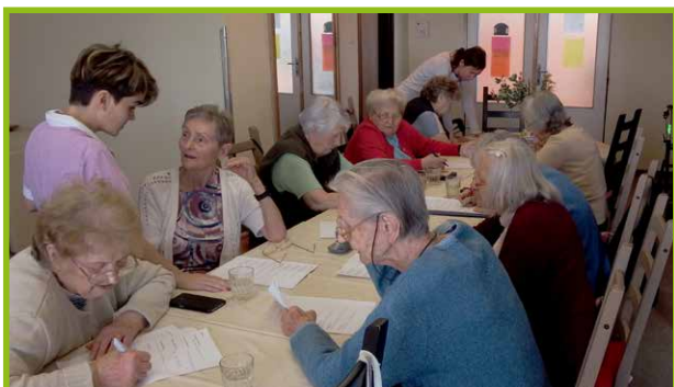
Pamäťový tréning vo Veľkom klube

Nie je z toho svalovica, ale tréning mozgu blahodarne vplyva na naše myslenie. V zariadení máme možnosť zúčastňovať sa Tréningov pamäti, ktoré vedú naslovovzatí odborníci v tejto oblasti. Skupinový tréning sa vždy začína rozcvičkou, pri ktorej sa rozcvičí hlava, cievy vyživujúce mozog aj svaly celého tela. Takto rozcvičení potom písomne aj ústne, riešime rôzne testy na oživovanie krátkodobej či dlhodobej pamäti. Pamäť si môžeme tréningovať aj sami počas celého dňa napr. môžeme čítať, lúštiť krížovky či sudoku... Dôležité je neprestať myslieť :)