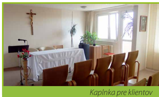
Kaplnka pre klientov

Vážený priatelia! Predstavte si, prosím, že by sa nám podarilo zhromaždiť všetkých obyvateľov Domu tretieho veku na jedno miesto, aby si tam porozprávali svoje životné príbehy. Iste by sa nestalo, aby sa jeden príbeh podobal druhému ako vajce vajcu. Do zariadenia si každý z nás priniesol svoj vlastný prežitý život osobitný a neopakovateľný. A predsa sa nájde, istá spoločná hodnota, ktorá spája spoločenstvo s celým našim národom. Je to viera kresťanov. Jej nositeľmi ľudia, ktorí od svojich predkov, prastarých rodičov a rodičov, prevzali štafetu viery a nesú ju verne v dobách slobody aj prenasledovania, v časoch dobrých aj zlých. Chceme Vám preto predstaviť miestnosť na 12. poschodí, kaplnka, kde môžete získať hlboký duchovný zážitok, ktorý dáva veriacim iba Boh. Dovolíme si preto odcitovať významného teológa Hansa Urs von Balthazara: „Kristus hľadá v mojej duši Otcovu vôľu. Otec v nej hľadá Synov obraz. Keď sa v nej obidvaja stretnú, je duša plná Ducha svätého.“