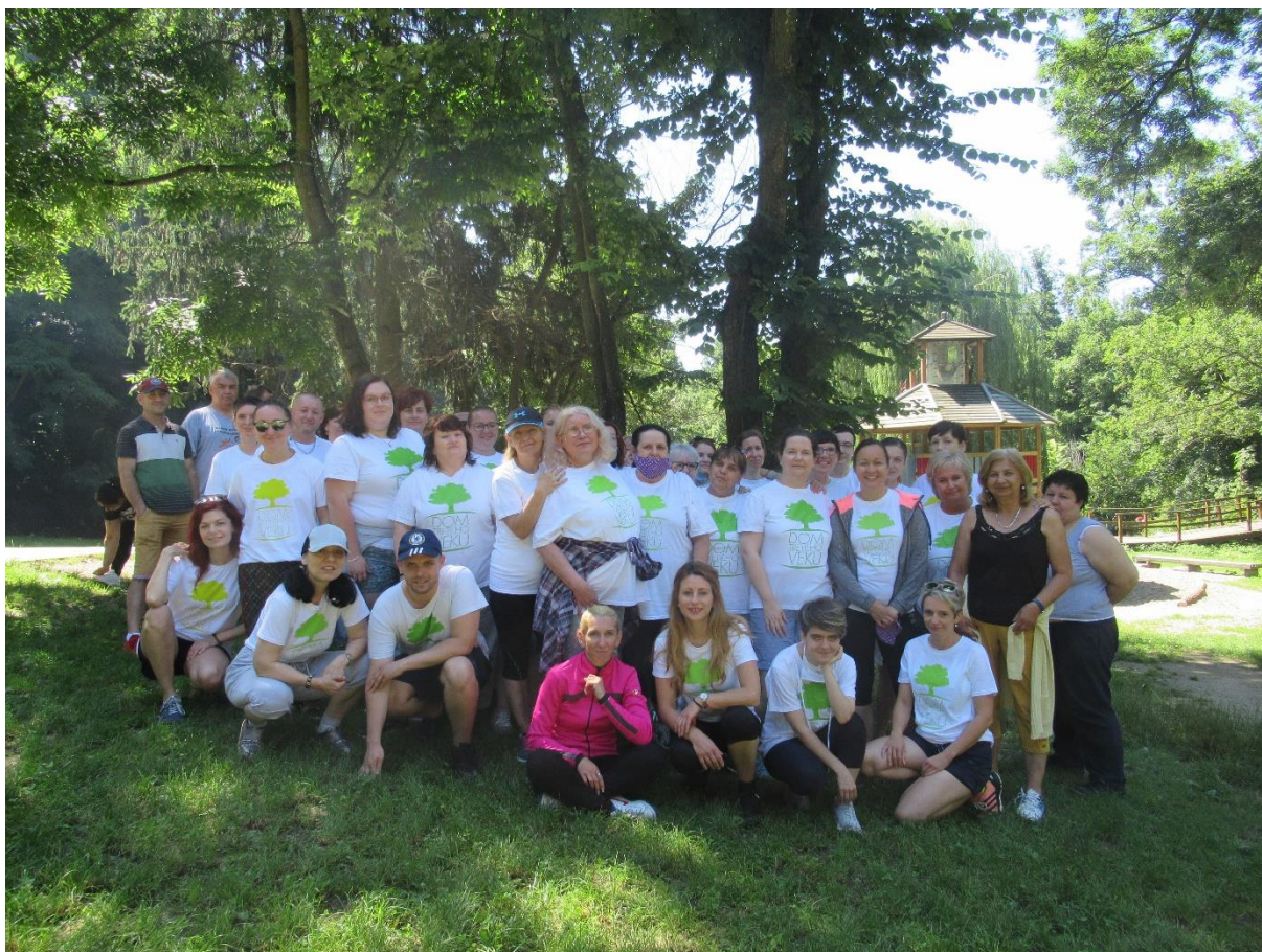
Športový deň zamestnancov, Železná studnička, júl 2020