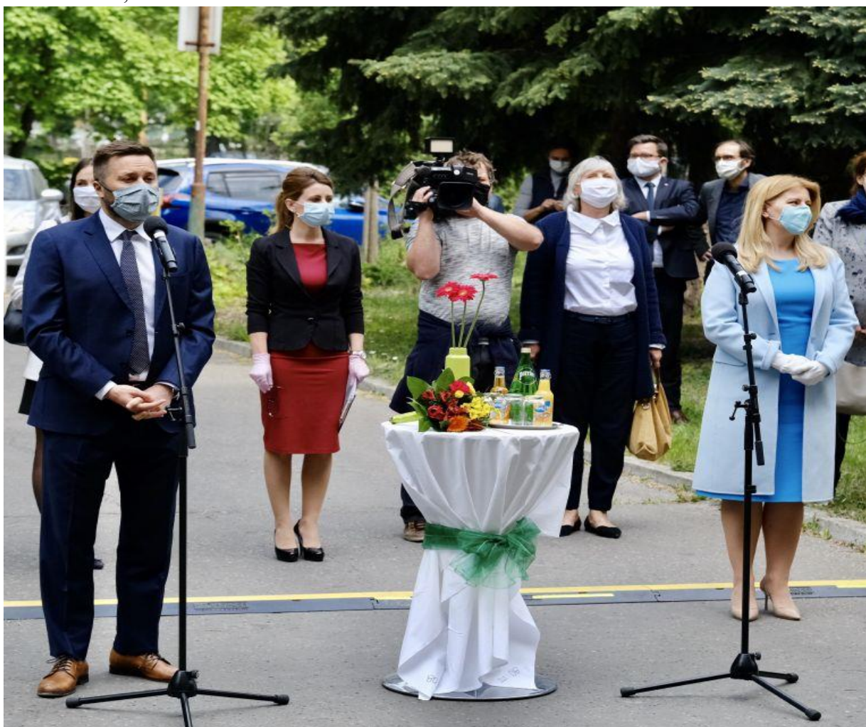
Návšteva pani prezidentky v zariadení, spojená s koncertom sláčikového kvarteta pre klientov, 27.4.2020,