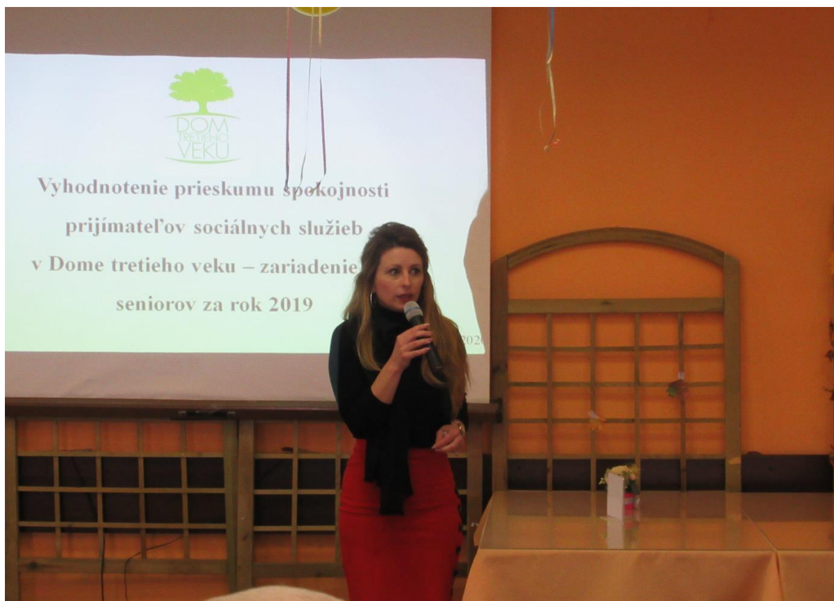
Vyhodnotenie prieskumu spokojnosti za rok 2019, 27.2.2020