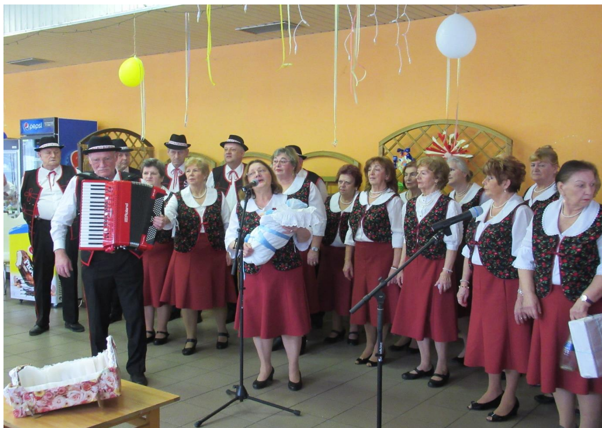
Hudobné pásmo s piesňou starneme pomalšie, 25.2.2020