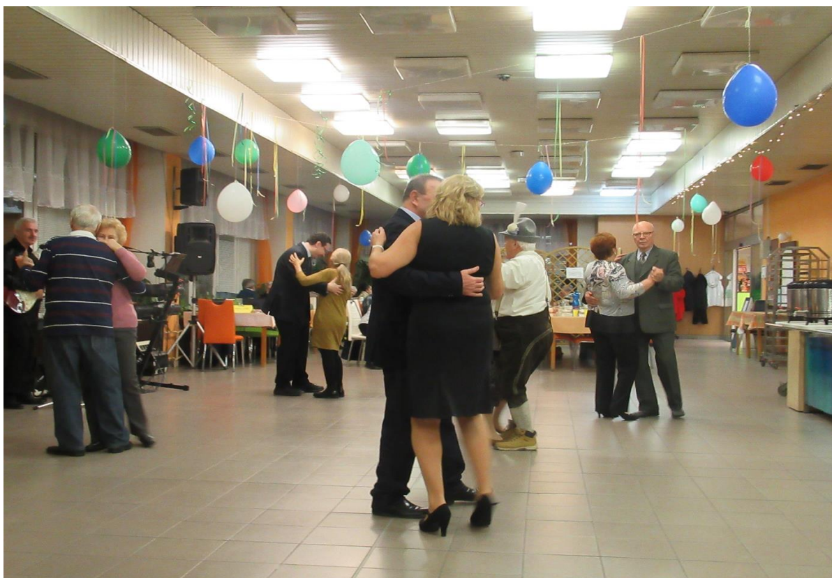
Fašiangová zábava, 8.2.2020