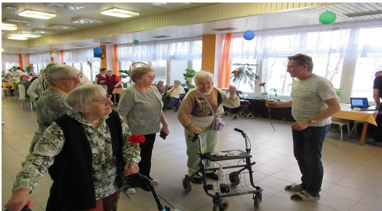
Oslava MDŽ, 4.3.2020