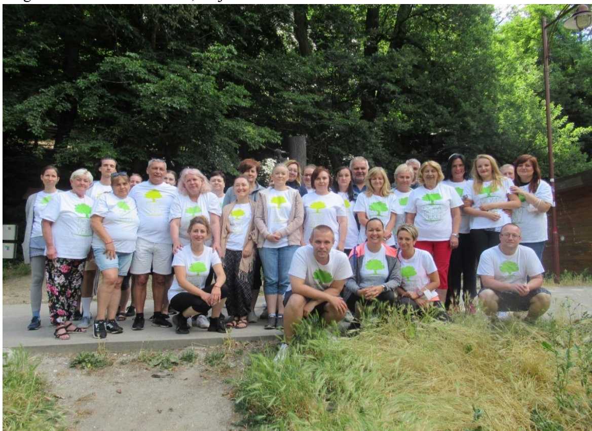
Športový deň zamestnancov, Železná studnička, júl 2021