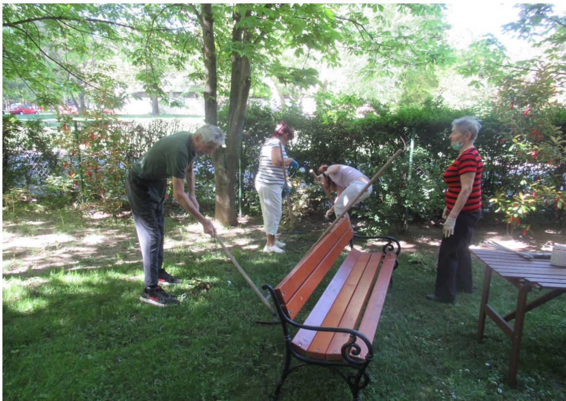
Brigáda v záhrade zariadenia, máj 2021