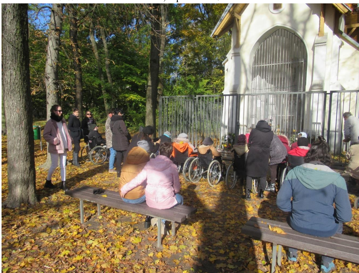
Vychádzka ku kaplnke, Pamiatka zosnulých, november 2021