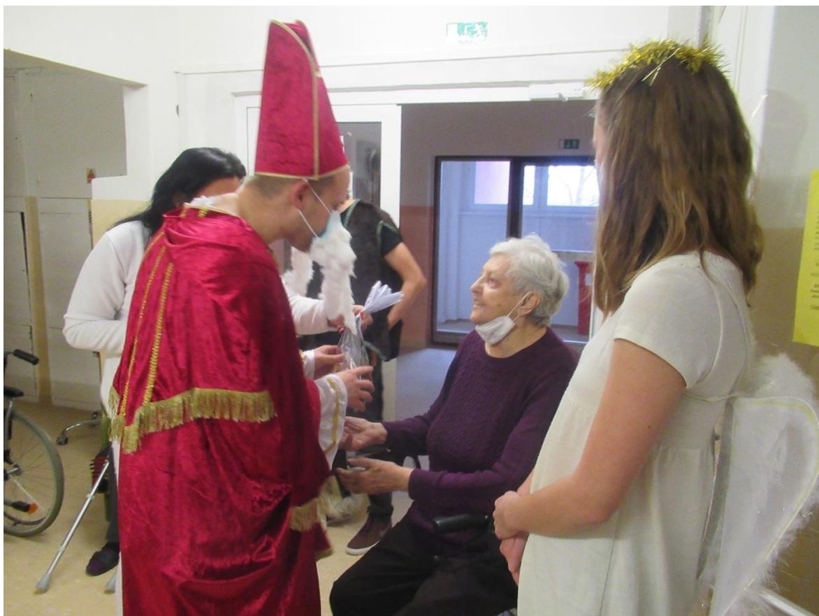
Návšteva sv. Mikuláša v zariadení DTV, december 2021