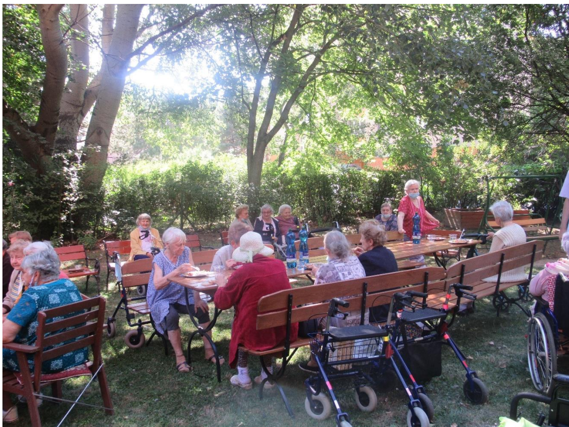
Grilovačka klientov v záhrade zariadenia, september 2021