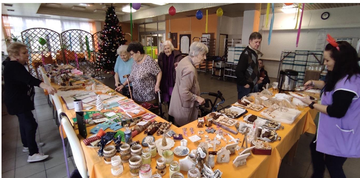
Vianočné trhy v DTV