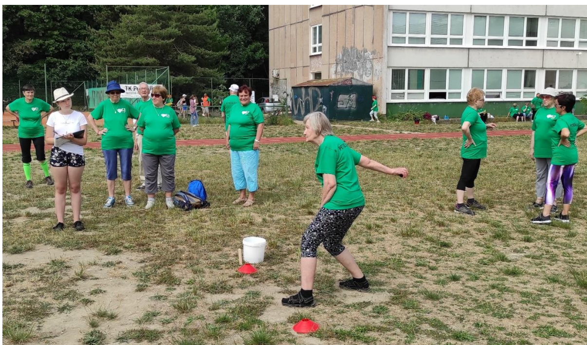
Športové hry seniorov, jún 2022