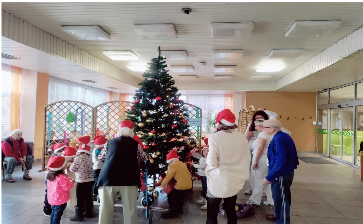
Zdobenie vianočného stromčeka