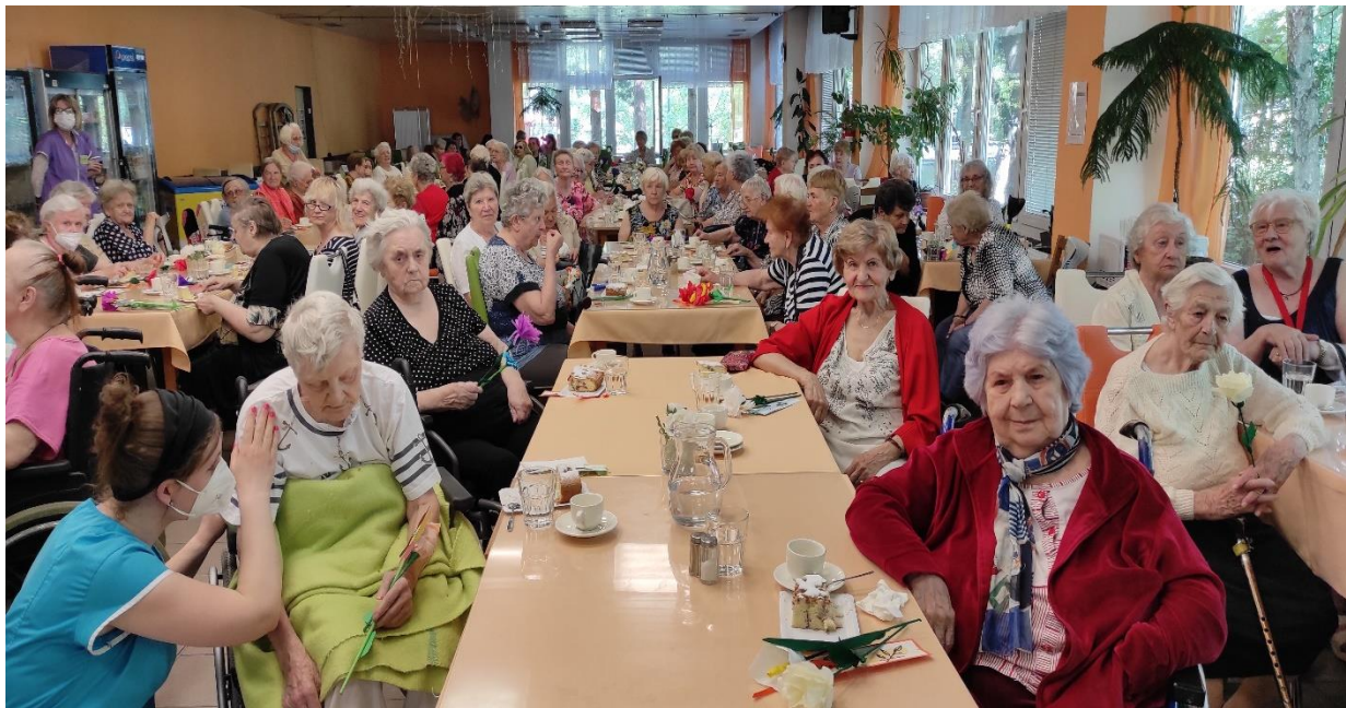
Oslava Dňa matiek, máj 2022