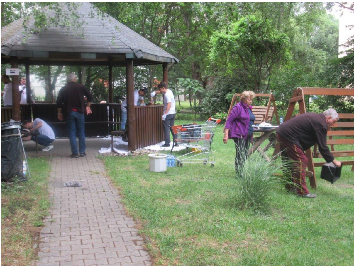
Deň dobrovoľníkov „Naše mesto“